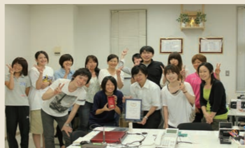
Eストア2012夏ドリンク部門全国1位受賞