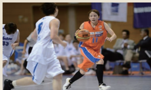
アルビレックスBBラビッツ