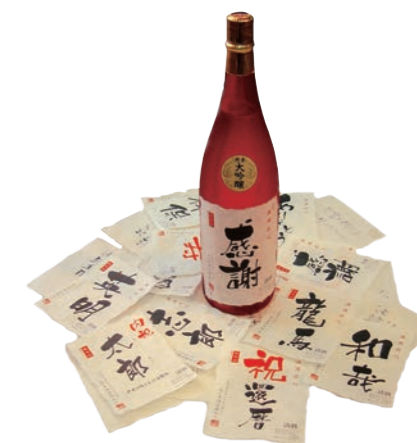
主力商品の『記念日新聞付き名入れ酒』