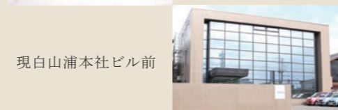
現白山浦本社ビル前