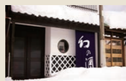
創業の地、 医学町通本社前

幻の酒は社会人スポーツの支援活動を通じて地域社会に貢献しています。平成26年2月現在、アルビレックスレディース(サッカー)の選手が1名、アルビレックスBBラビッツ(バスケットボール)の選手が2名、アルビレックスランニングクラブ(陸上競技)の選手が1名が共に働いています。